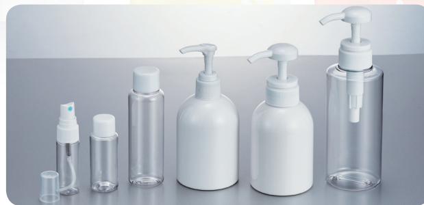
PETコメット20 PET30-I PET100BL ライフPET250 24mm用 ライフPET250 32mm用 アリエス 3G-PET300