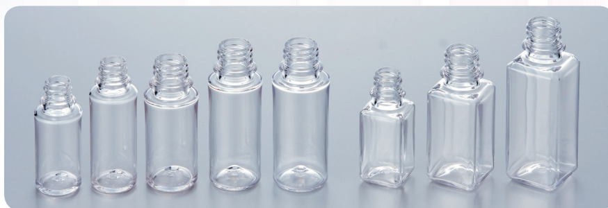
MSB-10 MSB-15 MSB-20 MSB-25 MSB-30 MSBK-15 MSBK-30 MSBK-50