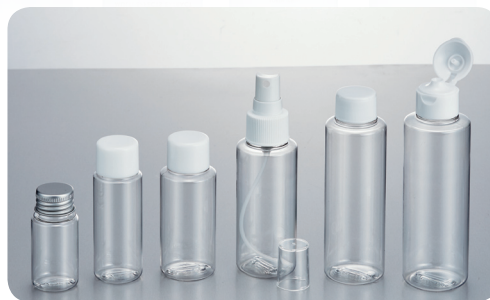
PET 30A PET 50A PET 70A PET100A PET120A PET150A