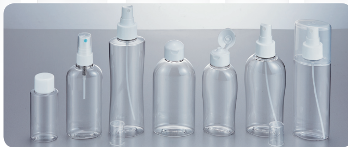
PET600V PET120 小判 PET200GAT PET200G PET120GT PET200GT PET150GAW